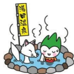
山口県PR部長ちよるる