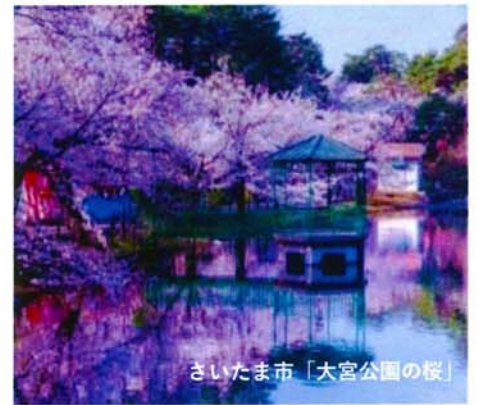
さいたま市「大宮公園の桜」