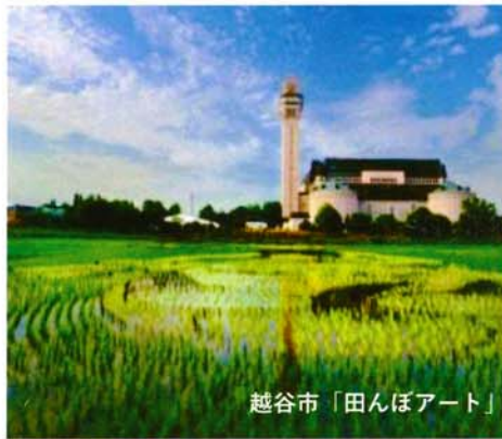
越谷市「田んぼアート」