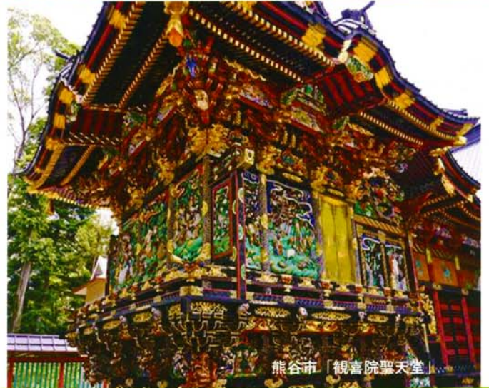
熊谷市「観喜院聖天堂」

第71回全国国公立幼稚園・こども園長会総会・研究大会 第53回関東甲信越国公立幼稚園・こども園長研究協議会