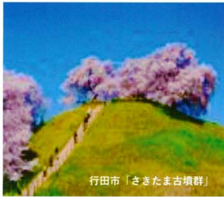
行田市「さきたま古墳群」