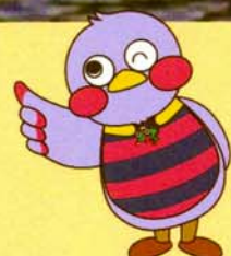
埼玉県マスコット 「さいたまっち」