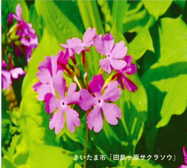
さいたま市「田島ヶ原サクラノウ」