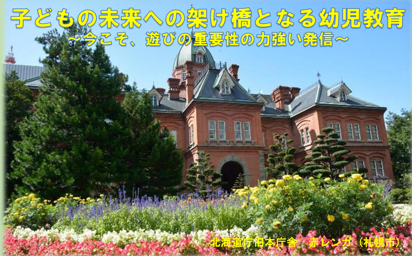
北海道庁旧本庁舎 赤レンガ (札幌市)